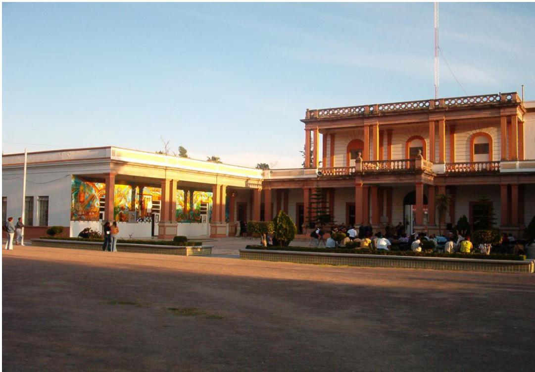
Figura 1. Fachada Principal del ITR.

Los puntos experimentales deben marcarse visiblemente, se sugiere escalas apropiadas que destaquen lo que se desea mostrar. Al igual que los cuadros, todas las figuras deberán estar expresamente citadas en el texto, en orden progresivo (Figura 1).